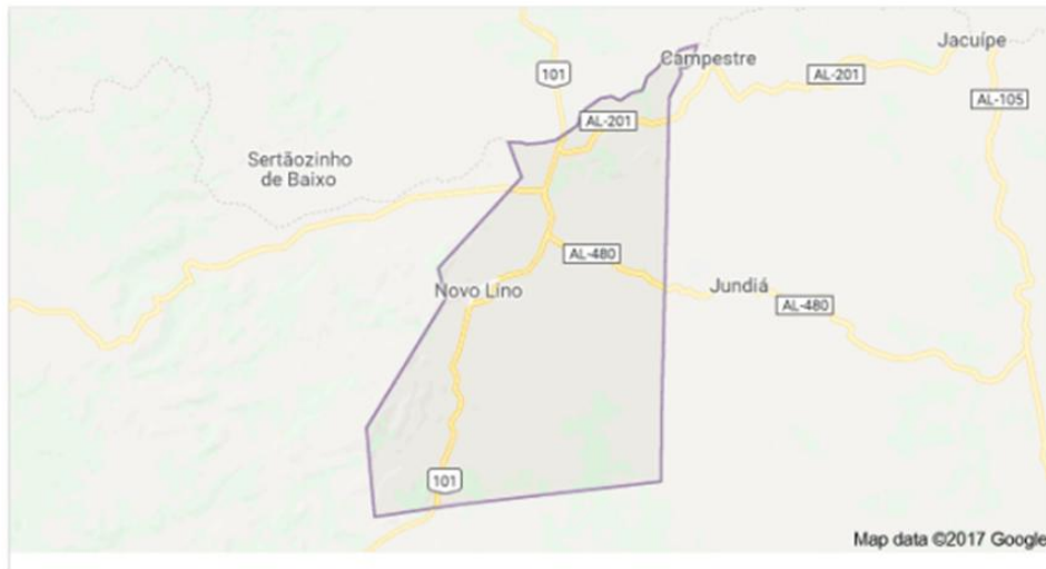
Figura 01 - Localização município Novo Lino.