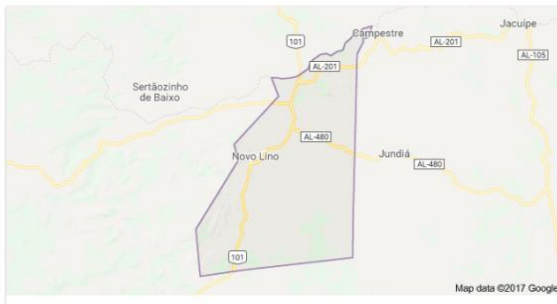
Figura 01 - Localização município Novo Lino.